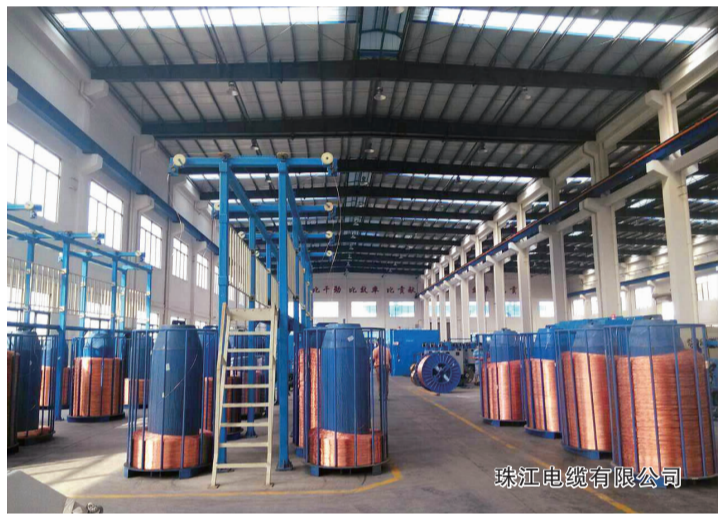
珠江电缆有限公司

走过十八个春秋,中窑的成长与发展离不开供应商的相伴与支持。他们为公司提供满意的产品提供了坚实的后盾,作出了巨大贡献,是公司企业命运共同体。为在新常态业务转变中提供更优质服务、更满意产品给到客户以及更进一步加深交流合作,共商发展大计。自4月下旬起,由采购部牵头组织,公司高层常务副总、生产总监带队,领队生产、技术、品管、PMC等相关部门管理人员,对振鸿、盈捷、建业、泰莱、星光、摩根、华宝、成功阀门等多家配